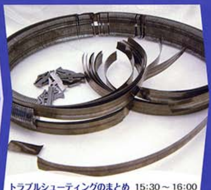
トラブルシューティングのまとめ 15:30 ~ 16:00