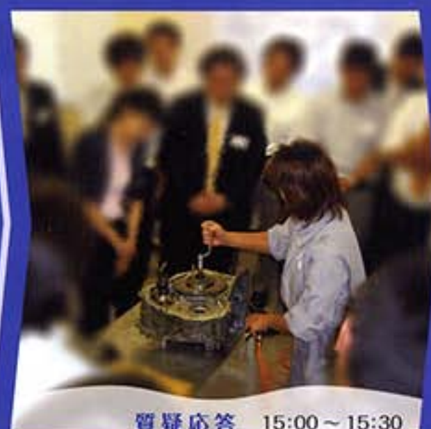
質疑応答 15:00 ~ 15:30