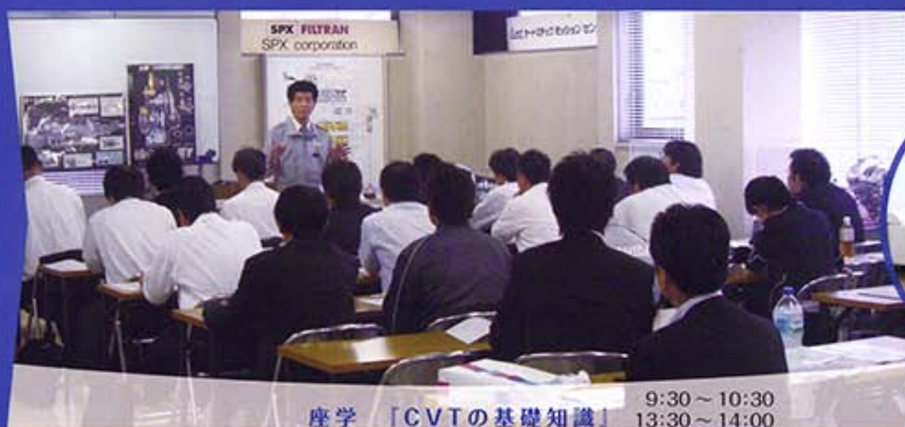
座学 「CVTの基礎知識」 9:30～10:30 13:30～14:00