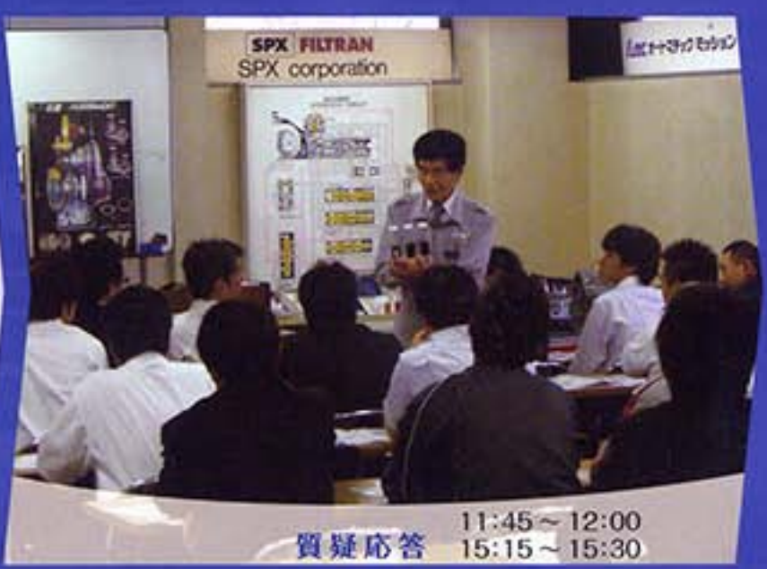
質疑応答 11:45 ~ 12:00 15:15 ~ 15:30