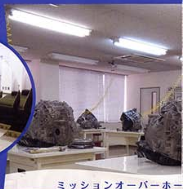
ミッションオーバーホール