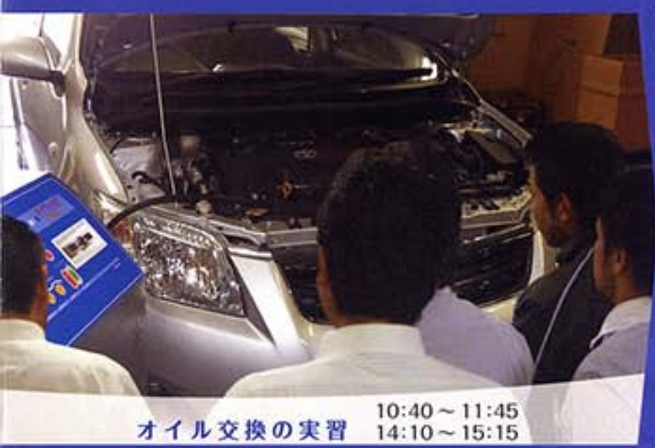
オイル交換の実習 10:40 ~ 11:45 14:10 ~ 15:15

構造を知ること、ATとの違いを知ること、CVTのメンテナンスにはフルードメンテナンスが重要です。 増販を学びませんか。