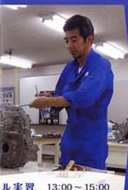
組立実習 13:00 ~ 15:00